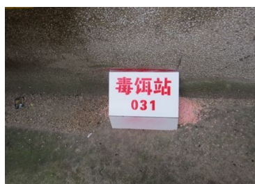
公园、动物园管理处及其他建筑物，公厕周边按规范设置灭鼠毒饵站，及时补充毒饵