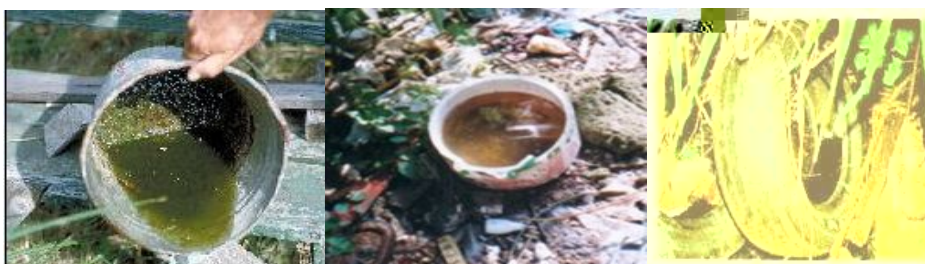
清除公园、动物园等各种废弃物和大小型积水