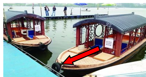
游船、划艇等防撞轮胎可进行钻孔，以防蚊虫孳生