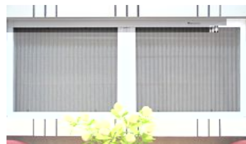
公厕与外界相通的排气孔或窗户可安装纱窗防止蚊、蝇进入