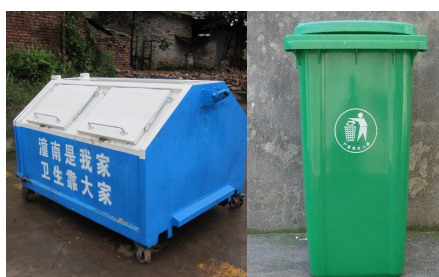
公园、动物园等室外使用带盖垃圾容器，及时清理垃圾，孳生蝇蛆的场所喷洒甲基嘧啶磷等杀虫剂杀灭