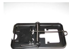
公园、动物园管理处等室内可选用粘鼠板、鼠笼、鼠夹等器械进行灭鼠，沿墙放置