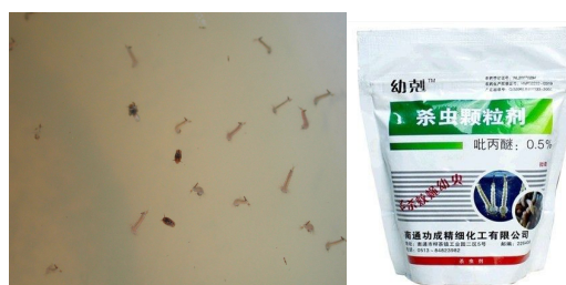
难以清除的积水可投放安备砂缓释剂等行灭蚊幼