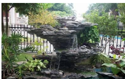
定期清理假山石窝面积水防止蚊虫孳生