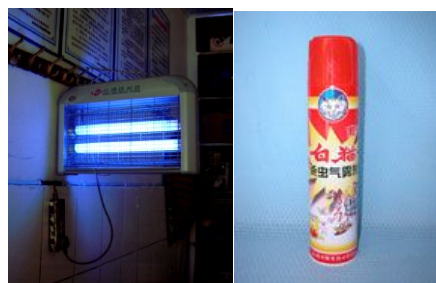
公厕安装灭蝇灯（不得靠墙，距离墙面20厘米以上）灭蝇，保持常亮状态，少量成蝇也可选用菊酯类杀虫剂灭蝇